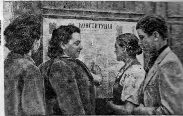
Жители г. Кишинева читают Сталинскую Конституцию.